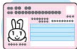
マイナンバーカード